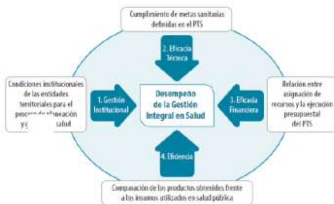
ESQUEMA 3. Esquema de Medición del Desempeño de la Gestión Integral en Salud en las Entidades Territoriales (GIG)

“La metodología de monitoreo y evaluación de los PTS establecida por el Ministerio de Salud y Protección Social plantea la medición del desempeño de la Gestión Integral en Salud de las Entidades Territoriales a través del análisis de los siguientes componentes: a) Gestión institucional, b) Eficacia técnica, c) Eficacia financiera y d) Eficiencia, tal como se muestra en el siguiente esquema:”