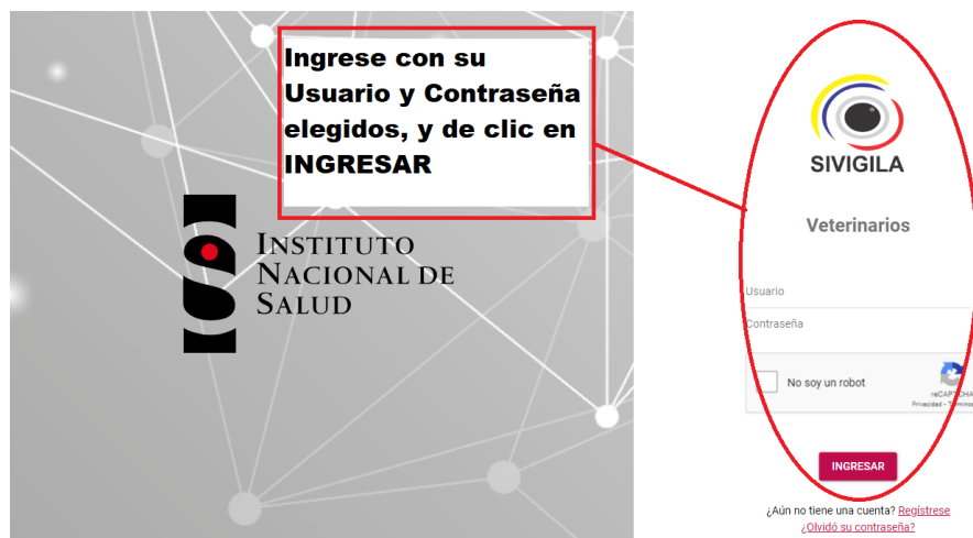
Figura 3. Ingreso de usuario y contraseña